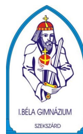
Béla I. Secondary Grammar School, Dormitory and Primary School ibela.sulinet.hu/gimnazium