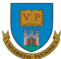
University of Pannonia www.uni-pannon.hu