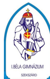
Béla I. Secondary Grammar School, Dormitory and Primary School ibela.sulinet.hu/gimnazium